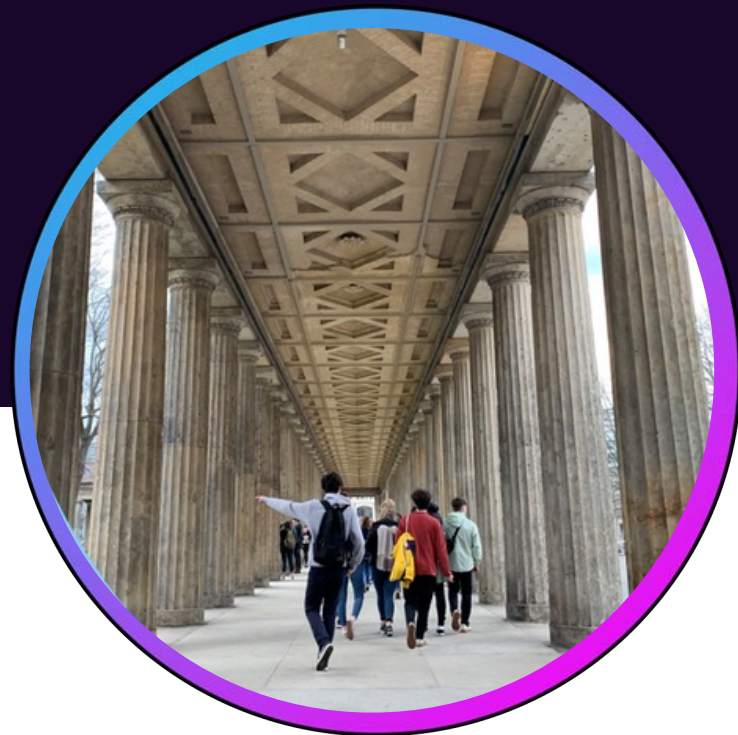
Tripiau sy'n gysylltiedig â'r pwnc