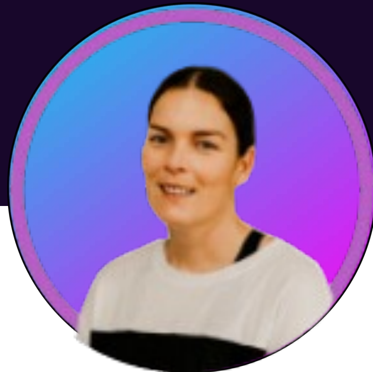
Lyn Ward Anogwr Dysgu